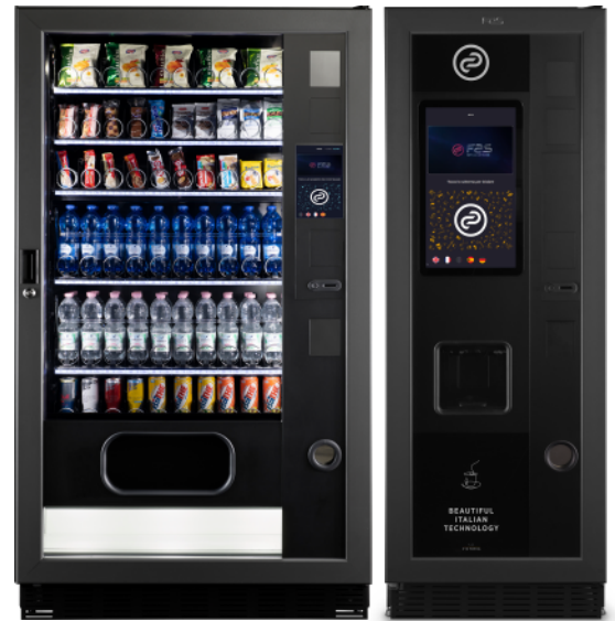
Fas 1050 Pro