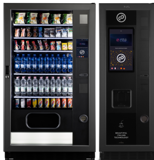
Fas 1050 Pro